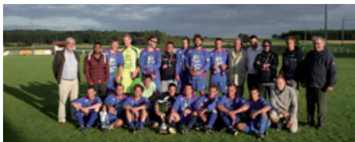
Equipe Première de la Royale Etoile Sportive Gesvoise