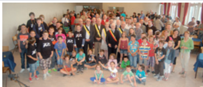
Remise des Trophées

Ce soir, nous fêtons le sport. Nous fêtons les nombreux talents que compte notre commune. Et vous allez voir... il y en a ! Pour récompenser vos performances, nous avons organisé cette remise des trophées à laquelle, vous le voyez, les amoureux du sport ont répondu présents.