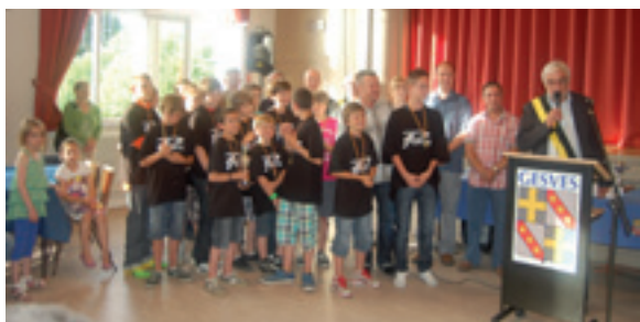
Equipe minime du Royal Cercle Sportif de Faulx-Les Tombes

Classement final : 1er avec 13 points sur 18