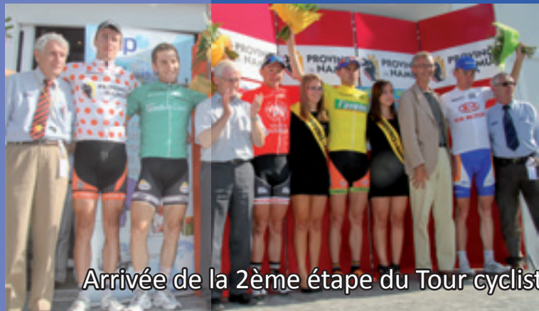
Arrivée de la 2ème étape du Tour cycliste de la Province de Namur – 2 août 2012