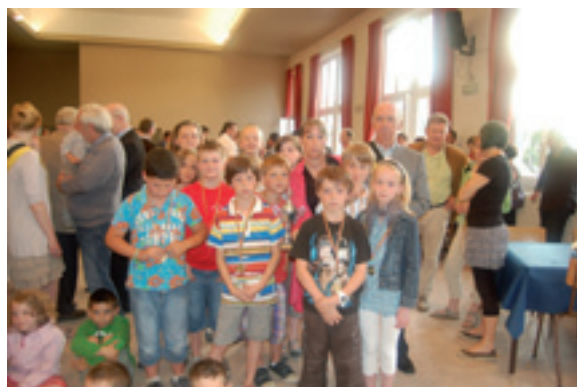
Equipe poussins du club de basket de Faulx-Les Tombes

Troisième équipe lauréate : l'équipe «poussins» du club de Basket de Faulx-Les Tombes.