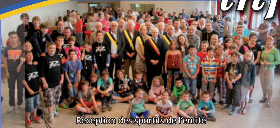
Réception des sportifs de l'entité